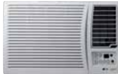
W121CM, W122CM W182CM, W242CM