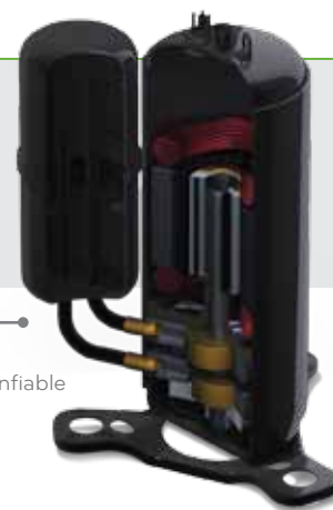
Compresor rotativo de LG : Eficiente y confiable

El Compresor Rotativo de LG tiene una buena reputación no sólo por producir bajo ruido y vibraciones bajas, sino también por ser altamente eficiente y confiable.